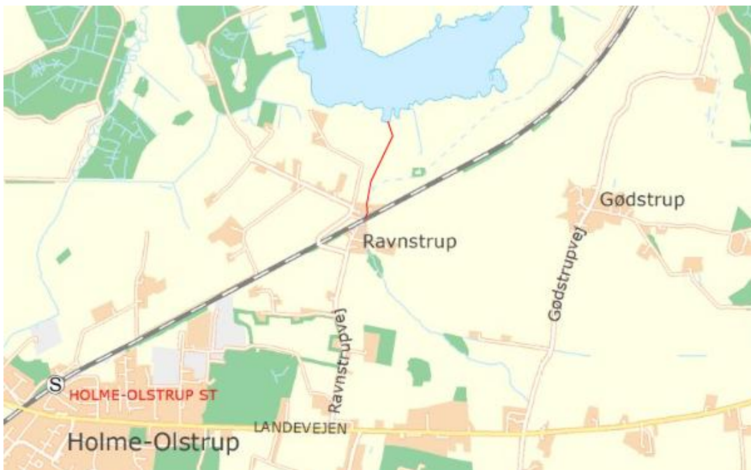
Kort over Tilløb til Gødstrup Engso, projektstrækningen er markeret med rødt

Tilløb til Gødstrup Engso er beliggende øst for Holme-Olstrup. Projektstrækningen løber fra landsbyen Ravnstrup til udløbet i Gødstrup Engso.