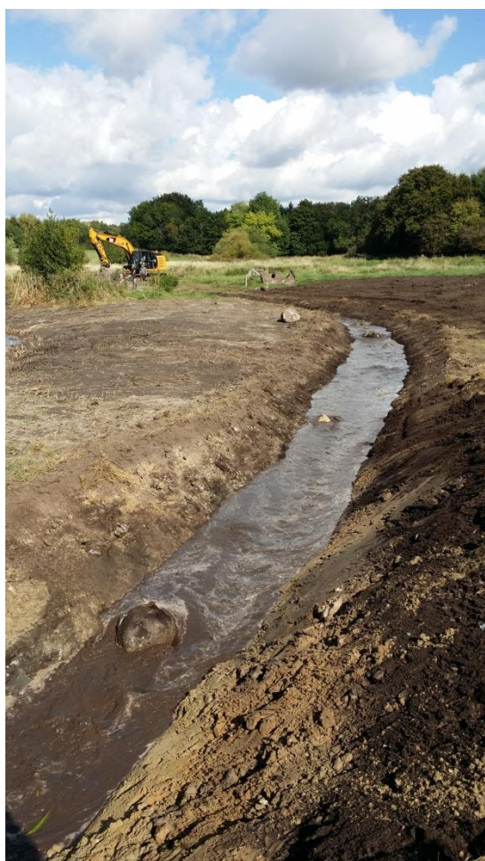
Vandet ledes ind i det nye vandløb