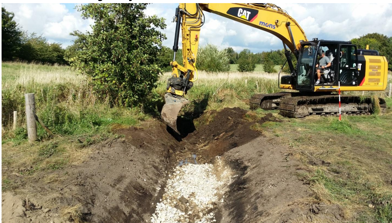
Der åbnes for den nye strækning, så vandet ledes på