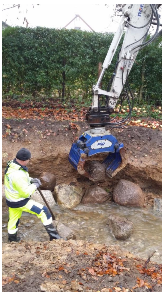
Store sten lægges ud til brinksikring og skjul